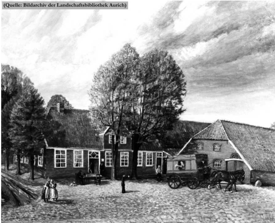
Gemälde der Posthalterei